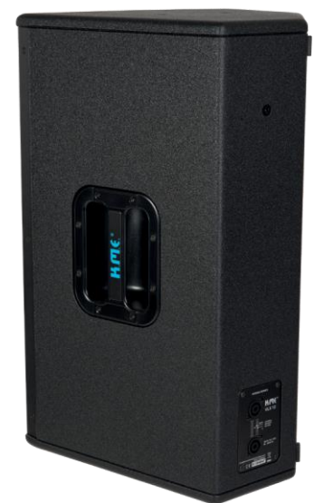
(dB) Level, SPL 1W 1m VLX12