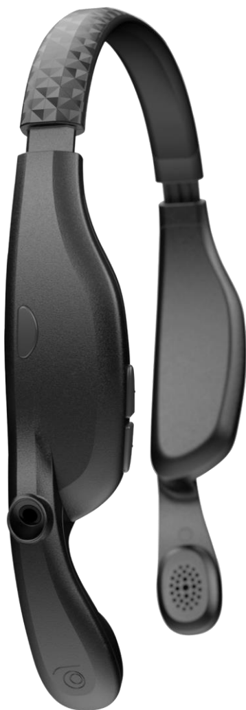
The Twist Nie dotyka uszu!